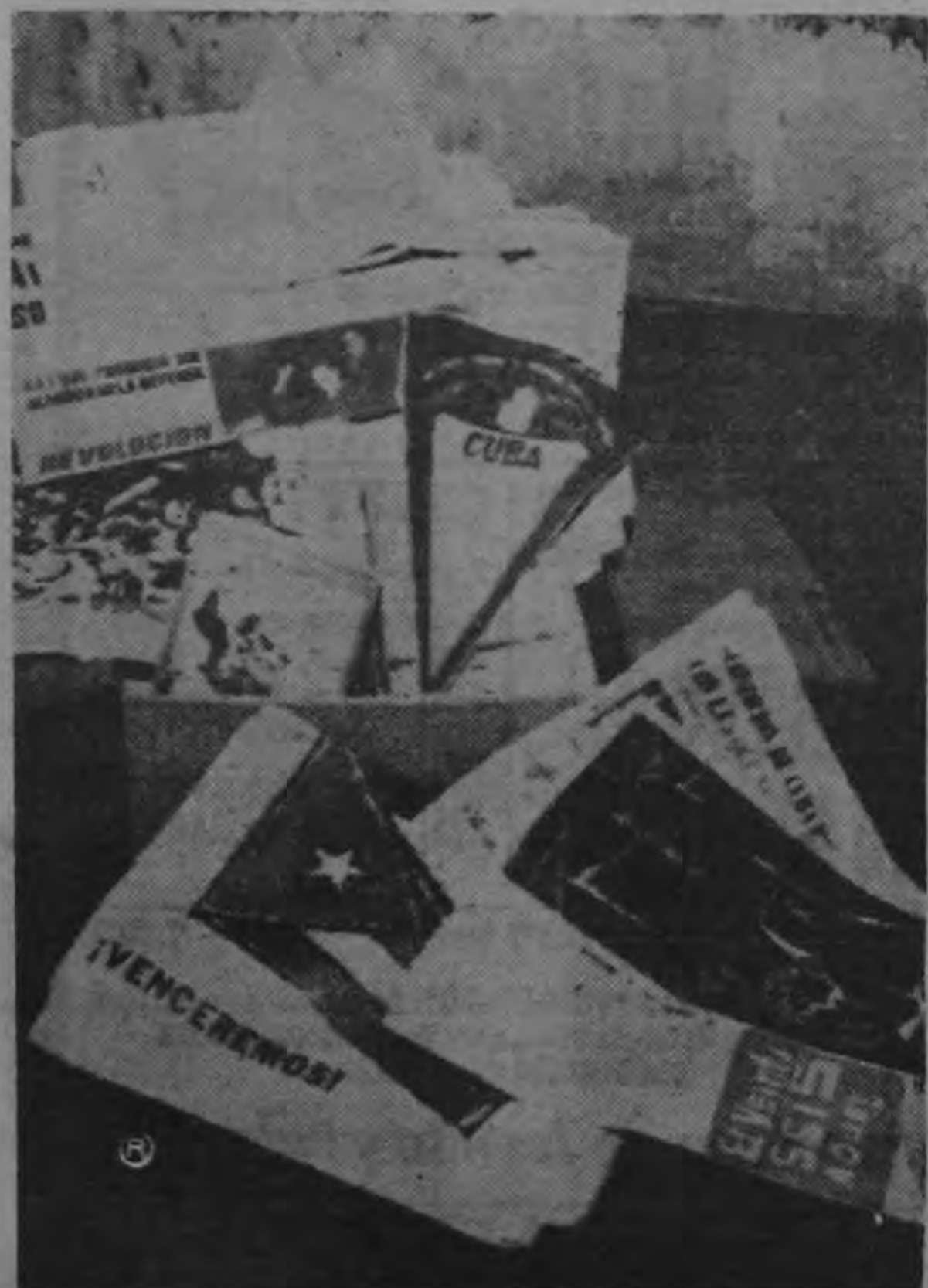
La gráfica corresponde a uno de los últimos decomisos de propaganda procedente de Cuba. El secuestro de esta literatura fue hecho por oficiales de investigación de los equipajes de los grupos de conspiradores que viajaron a Cuba para asistir a la conmemoración del 2º aniversario de la Revolución. La propaganda fue calificada de subversiva y en consecuencia decomisada. Será ahora el Ministerio de Gobernación, en cuyo poder se encuentra ahora, quien decida finalmente sobre su calificación; y si se puede devolver parcial o totalmente a sus dueños, o quedará definitivamente en poder de las autoridades.